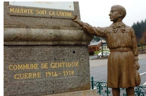
Un haut lieu de rassemblement pacifiste : le monument aux morts de Gentioux.

ou par téléphone au 05 55 48 51 72 ou au 06 31 80 37 37