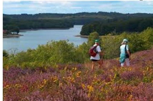
Randonnées autour du lac