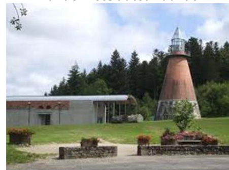
Centre d'art contemporain sur l'île de Vassivière