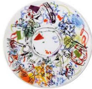
Porcelaine Bernardeau, « collection Chagall »