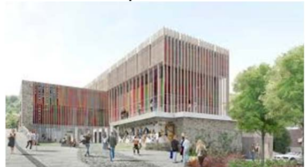
Cité internationale de la tapisserie à Aubusson